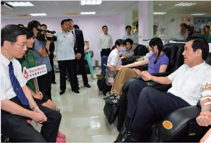
◆ 馬前總統和年輕人一起捐血，並和台灣血液基金會副董事長張上淳以及學生大使傅薺葳暢聊捐血的經驗。