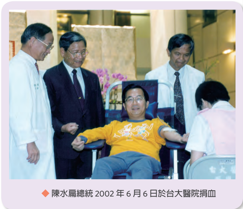
◆ 陳水扁總統 2002年6月6日於台大醫院捐血

前總統陳水扁從臺北市市長到擔任總統，不僅藉其身分呼籲，更是身體力行，也是積極推動捐血活動的推手。於1996年，在市府一樓，提供台北捐血中心設立「市府捐血室」，鼓勵市府員工以及方便前來洽公的市民有個舒適的捐血空間。1997年，於1月6日第二屆捐血月首日，帶領市府同仁在「市府捐血室」捐血，並親自廣播呼籲同仁踴躍參與。關注捐血議題並參與捐血，直至總統任內也持續不斷；每年在缺血時期即親自至捐血室視察及慰謝捐血人。