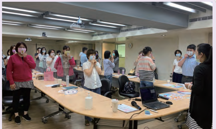
◆ 卓越服務計畫教育訓練