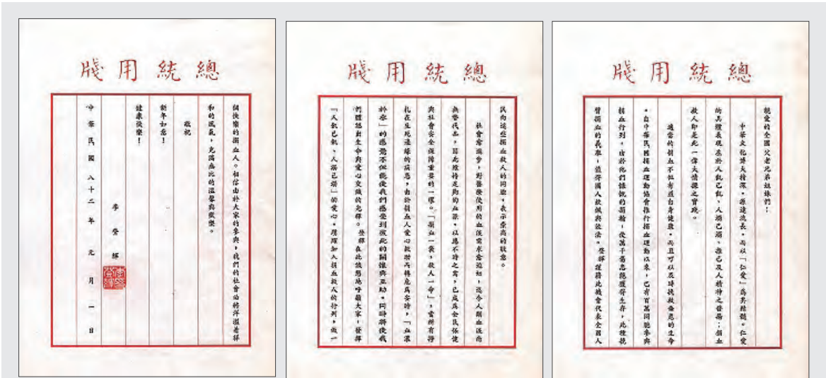
◆ 1993年1月2日，前總統李登輝首度發布總統文告，呼籲民衆做個快樂的捐血人。往後每逢捐血月容易缺血時期，本會均恭請總統發布總統文告，開啟歷屆總統透過公開信的方式來重視及呼籲全民捐血。

省政府主席時期，也多次前往台中捐血中心關切作業場所新建事宜。擔任總統時，更請捐血車駛入總統府，鼓勵總統府工作人員捐血，並開啟以發布總統文告的方式呼籲全民響應捐血；首辦親自召見績優捐血代表們進總統府的活動，名為「愛心一號專案」，讓捐血人倍感榮耀。對捐血的支持可說是不遺餘力，也為國家元首支持捐血建立典範。