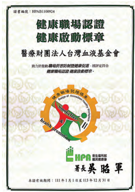
◆ 本會健康職場認證標章

員工健康促進包含獎勵員工參加動態活動，如：員工計步走活動、健行活動等；提供血壓計、體脂計、按摩椅等；外聘專家進行健康講題分享，包含職能物理治療、心理諮商、紓壓等課程；不定期宣導有關健康／均衡飲食、菸害防制、藥物食品安全等國家政策；肺炎鏈球菌疫苗注射公費支出；定期健康檢查等等。於 2021 年申請國民健康署健康促進職場認證，獲得啟動標章，持續推動友善職場，照顧好員工健康。