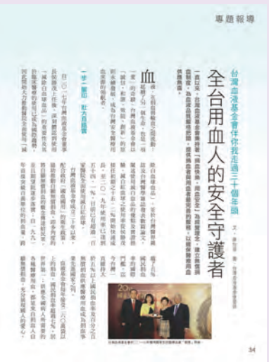
◆ 《卓越雜誌》2020 年 8 月號刊出基金會成立 30 週年專題報導及董事長侯勝茂專訪。

2020 年時基金會董事長侯勝茂接受《天下雜誌》專訪時表示：「優質又安全的血液供應是醫療體系運作的堅強後盾。」侯董事長深知供血品質及安全的重要性，自 2017 年擔任台灣血液基金會董事長以來，一直致力於提升台灣醫療用血來源之安全，積極推動醫院使用「滅除白血球血品」；同時，他也積極與國際分享台灣輸血安全的經驗，尤其冀望透過獨步全球的高效價 Mia 單株抗體，協助同樣有 Mia 抗體問題的東南亞國家與中國南方地區，發揮 Taiwan Can Help 的精神。