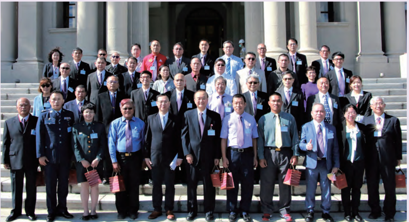
◆ 2021 年 11 月 29 日本會董事長侯勝茂 (中) 率績優捐血人代表晉見總統後於府前合影。