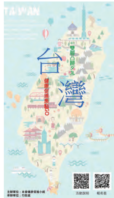
◆ 本會健走活動 2.0 進階版～健康促進集點 GO