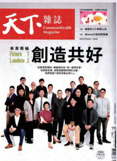
◆ 《天下雜誌》719 期刊登本會致力提升輸血安全之相關報導。