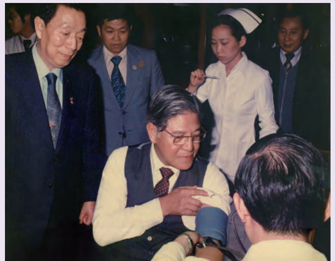
◆ 前總統李登輝捐血，帶領總統府員工和民眾一起響應捐血。