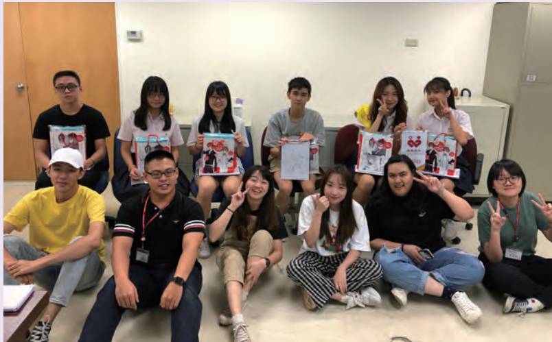
◆ 淡大實習生策畫拍攝影片「高中大亂鬥」。