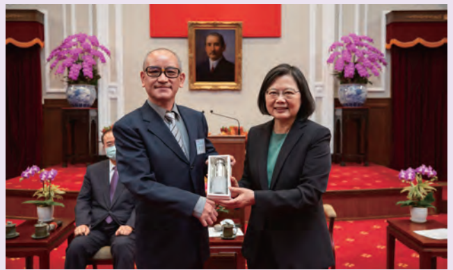
◆ 2020 年 11 月 27 日 (108) 年度績優捐血人代表晉見總統活動，總統蔡英文與受贈代表余天喜合影。