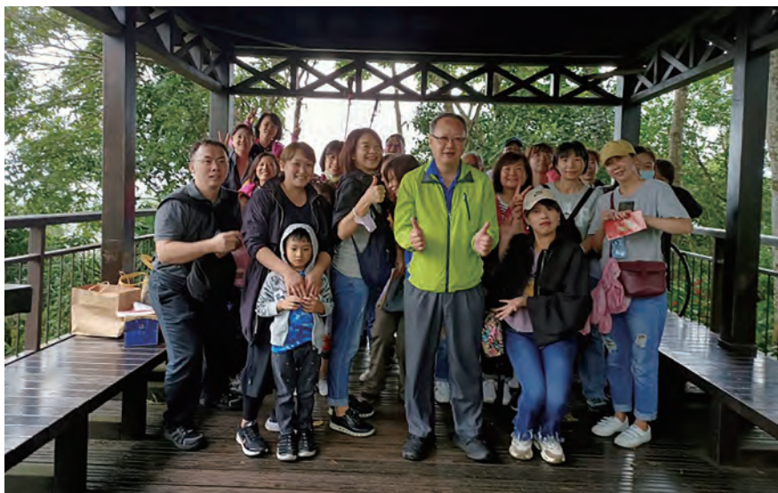
◆ 台北捐血中心仙跡岩健行活動