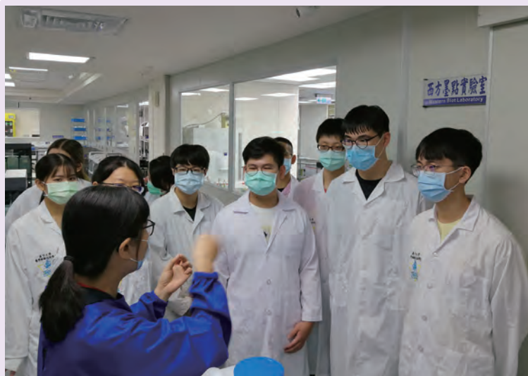
◆ 義守大學醫技系來捐血中心檢驗課實習血庫技術

臨床方面，馬偕醫院血液腫瘤科黃敬元醫師及宋嘉瑜醫師，參加「輸血專業醫師捐血中心培訓計畫」，至台北捐血中心針對血液採集、成分分離、血液檢驗、血品供應及血液諮詢實驗室業務等作業做完整的見習，亦提升了國內輸血醫學專業教學。