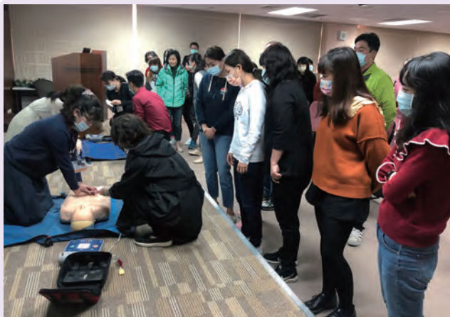
◆ 心肺復甦術教育訓練

為引導新進人員認識本會組織架構及各部門業務運作概況，本會規範新進人員到職後的一個月內完成通識教育，訓練內容含組織架構、環境介紹、部門業務簡介、職業安全衛生教育訓練、個資保護與資訊安全管理教育訓練及課組見習等。本會 2021 年度新進員工教育訓練共辦理 40 場次，訓練時數 1,245 小時。