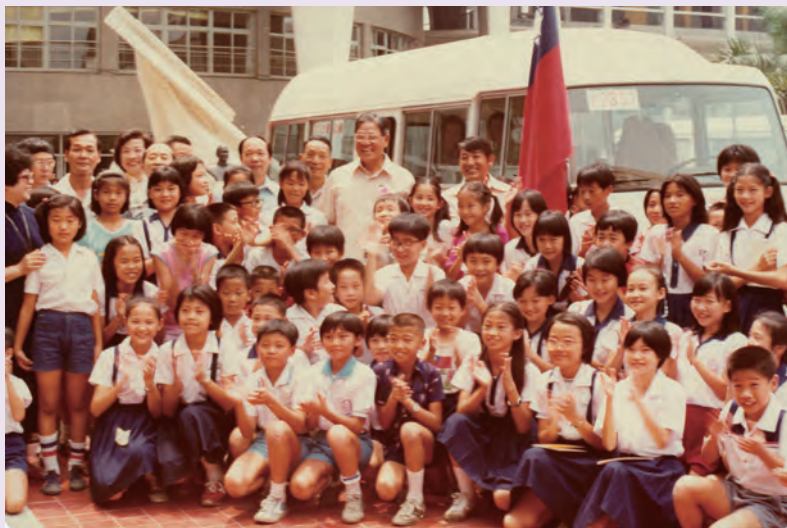
◆ 贈車典禮於 1981 年 7 月 15 日上午在台北市光復國小舉行，時任臺北市長的李登輝（後中者）與捐獻兒童愛心號捐血車的台北市國小師生合影。

李登輝前總統擔任臺北市市長時期，為推廣捐血，親至台北捐血中心捐血，恰巧成為第 15 萬號捐血人，爾後遇有捐血活動即響應捐血，並向市府員工宣導捐血的好處；任台灣