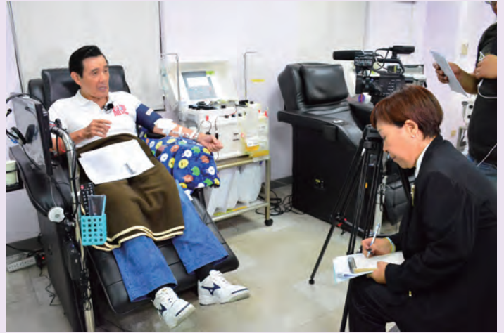
◆ 2017年9月29日，韓國 KBS 國家電視台來台灣採訪前總統馬英九先生的捐血經驗。（右一為政治大學韓文系董文君教授協助 KBS 現場翻譯。）