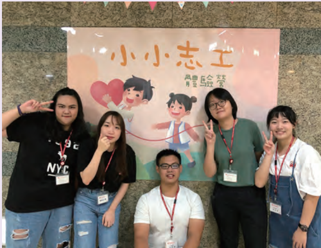
◆ 淡大實習生參與小小志工體驗營活動與設計宣傳。