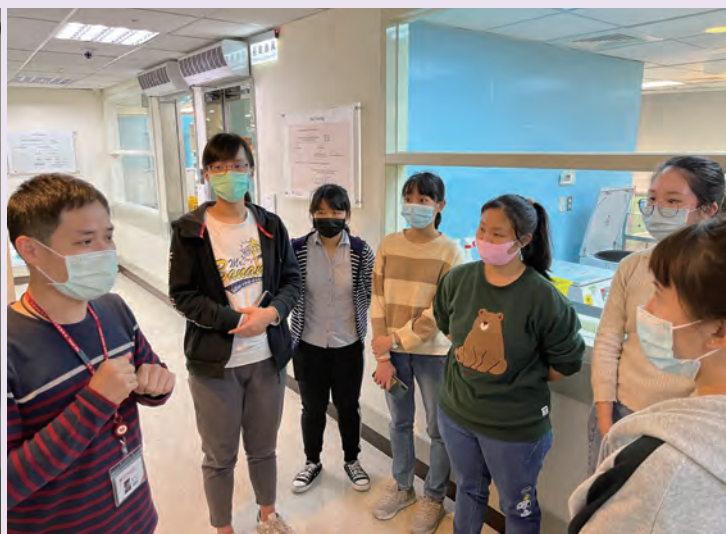
◆ 臺北醫學大學醫技系師生來本會深入了解捐血人檢驗程序