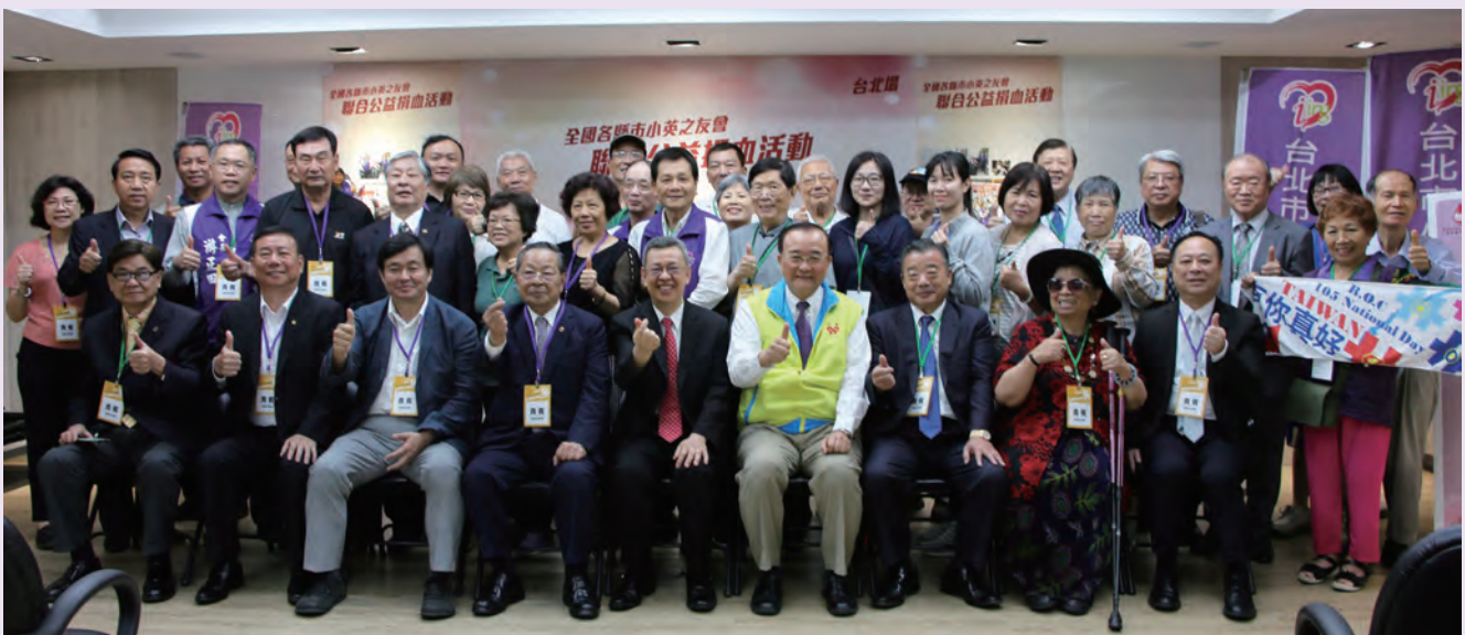
◆ 2019 年 5 月 20 日總統就職日，小英之友會特地在全國各地發起捐血活動，記者會並由副總統陳建仁主持，呼籲民眾捐血。

全國各縣市小英之友會是現任總統蔡英文在民間的基層支持者，也是在各行各業的好朋友，會員遍布全國各地。為推廣及鼓勵捐血，並力行關懷社會、實踐公益的社會責任，自 2017 年起，每年在全國各地辦理捐血活動，至 2021 年底已累積捐入 17,779 袋血液，期望透過眾人的熱血，支持每位需要輸血療疾的傷病患。